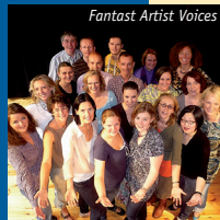
Fantast Artist Voices